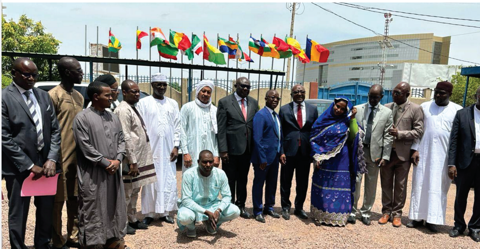
Photo de famille lors de la cérémonie de passation des charges