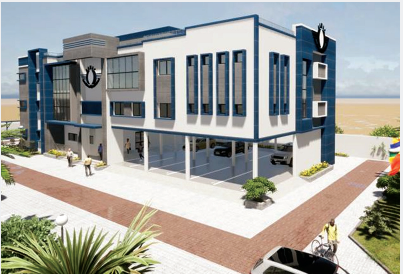
Nouveau siège des AAMAC en cours de finition

Par la même occasion, le RWANDA, nouvel Etat membre de l'ASECNA, a été invité par le Président à se joindre aux AAMAC.