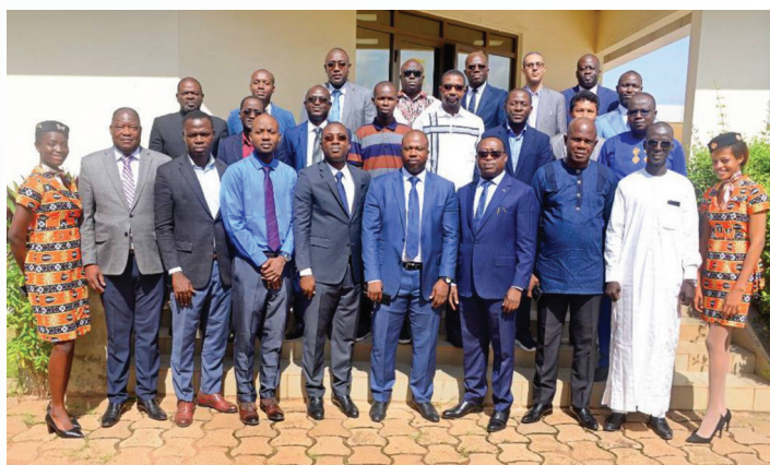
Photo de famille à la session de formation sur la méthodologie de conduite des Etudes de Sécurité à Cotonou du 19 au 30 juin 2023