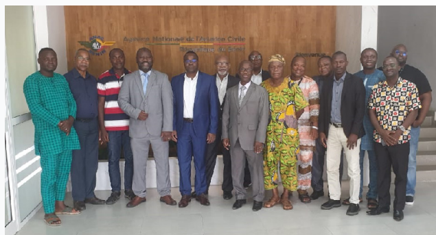
Photo de famille de la cérémonie de clôture (Formation Enquêtes sur les accidents d'avion)

Enquêtes sur les accidents d'avions du 13 au 23 novembre 2023 ANAC Bénin (Formation de 12 personnes)