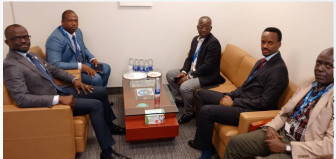
Séance de travail AAMAC— ASECNA—CASSOA