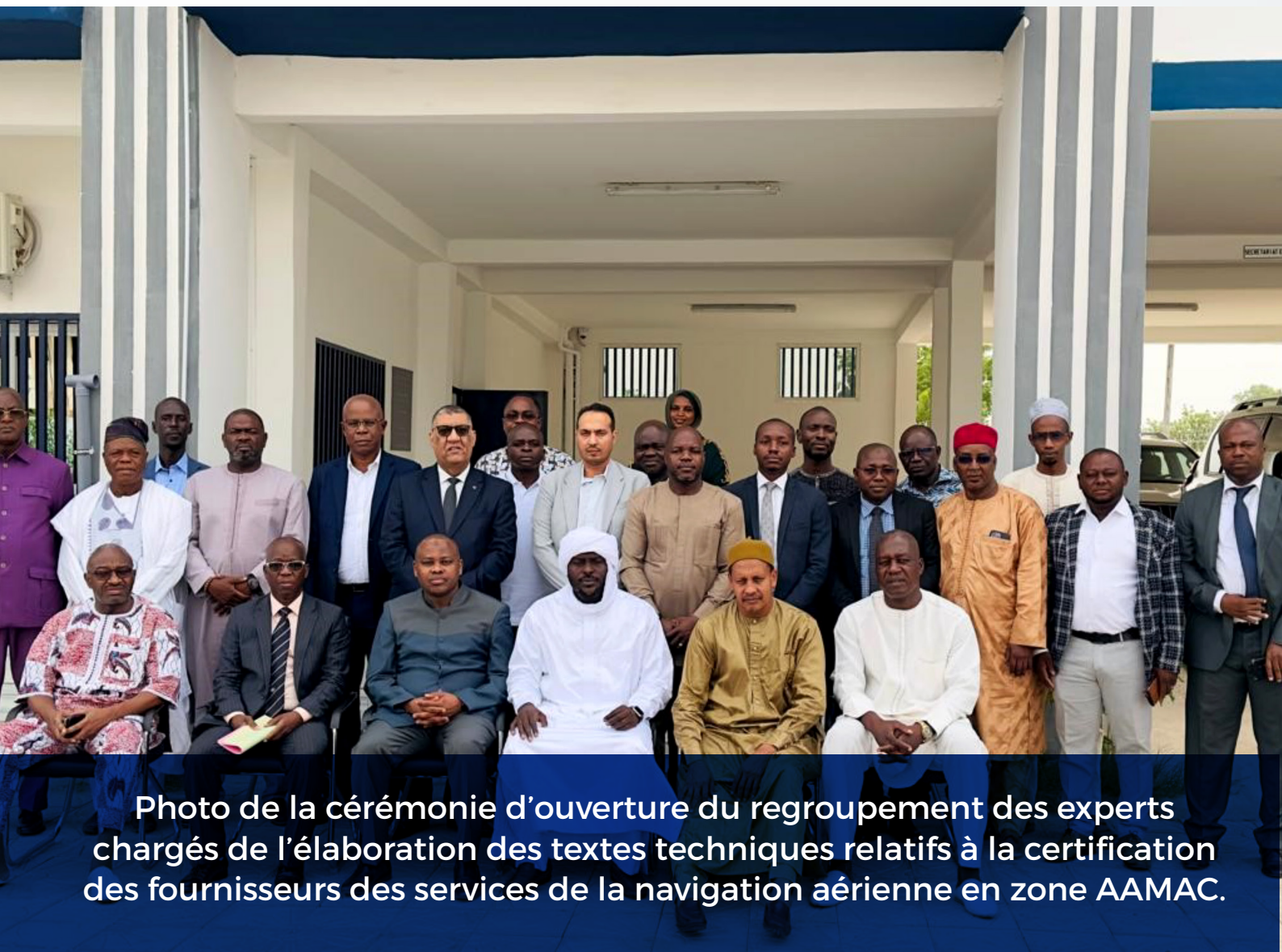
Photo de la cérémonie d'ouverture du regroupement des experts chargés de l'élaboration des textes techniques relatifs à la certification des fournisseurs des services de la navigation aérienne en zone AAMAC.

Un regroupement d'experts a eu lieu sur la période du 13 au 24 mai 2024. Ce regroupement s'inscrit dans le cadre du programme d'activités des AAMAC pour l'année 2024 adopté lors de la 51ème session de son Conseil, tenue à Dakar au Sénégal, le 05 décembre 2023. Cette rencontre a permis des avancées significatives dans le processus d'élaboration des textes sur la certification des fournisseurs de services de navigation aérienne (ANSP) en zone AAMAC ainsi que les critères de reconnaissance des certificats des ANSP délivrés par un Etat.