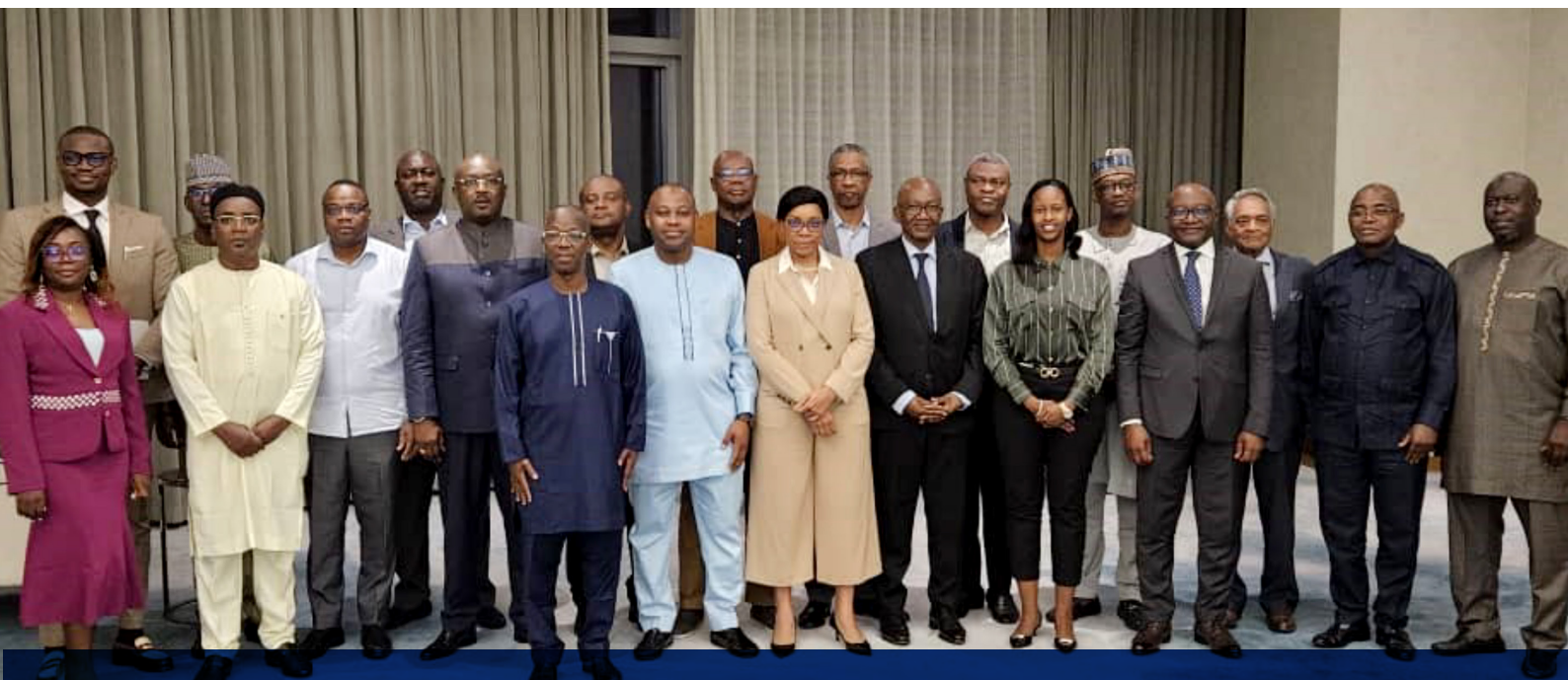
Photo de famille du conseil des AAMAC