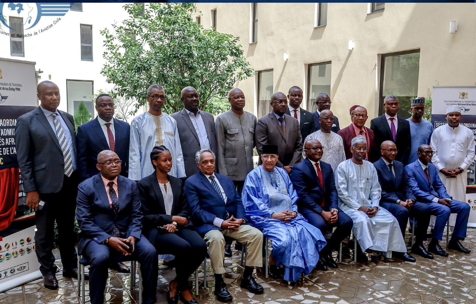
Photo de la cérémonie d'ouverture du Conseil extraordinaire des AAMAC du 16 avril 2024