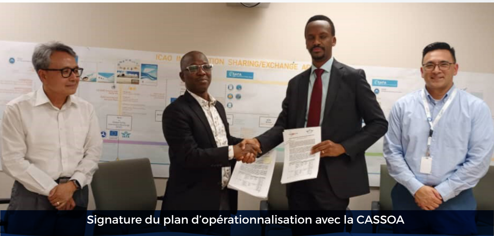
Signature du plan d'opérationnalisation avec la CASSOA