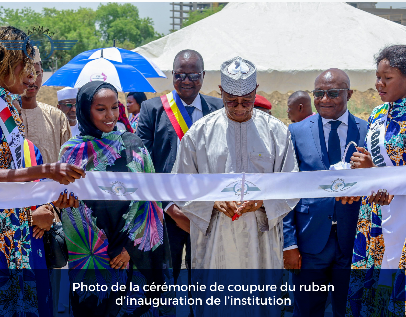
Photo de la cérémonie de coupure du ruban d'inauguration de l'institution

Cette cérémonie a connu la participation effective des représentants du Gouvernement Tchadien, des Directeurs Généraux et Administrateurs des AAMAC, du Directeur Régional Adjoint de l'OACI, du Directeur Général de l'ASECNA, des anciens PCA des AAMAC, des anciens DG de l'ASECNA, les organisations régionales sœurs en matière de supervision de la sécurité, de l'ancien Secrétaire Exécutif des AAMAC, du personnel des AAMAC à la retraite ainsi que d'autres partenaires.